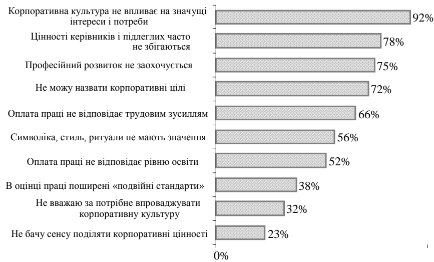
Рис. 2. Окремі результати соціологічного дослідження ролі корпоративної культури в розвитку людського капіталу (у % до кількості опитаних працівників підприємств, 2015 р.)