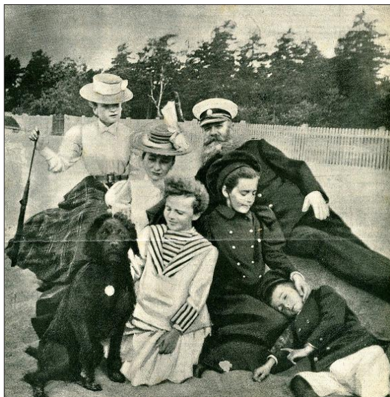
Рис. 5. С.О. Макаров с семьёй на отдыхе