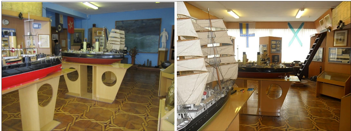
Рис. 2. Мемориальный музей адмирала Степана Осиповича Макарова, 2015 г.

ния Якова) его послужной список. Стало известно, что у Якова Осиповича во время его службы на Дальнем востоке в гражданском браке были дочь Клава (Каля), которую он удочерил в 1882 г., а также сын Василий, ставший впоследствии священником и служивший в Томске и Красноярске. Женат на известной в то время писательнице Мирской. У них было 12 (по другим данным – 7 детей).