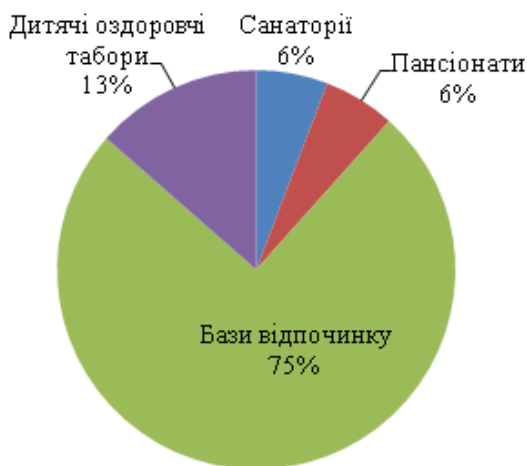
Рис. 2. Спеціалізовані засоби розміщення в Миколаївській області