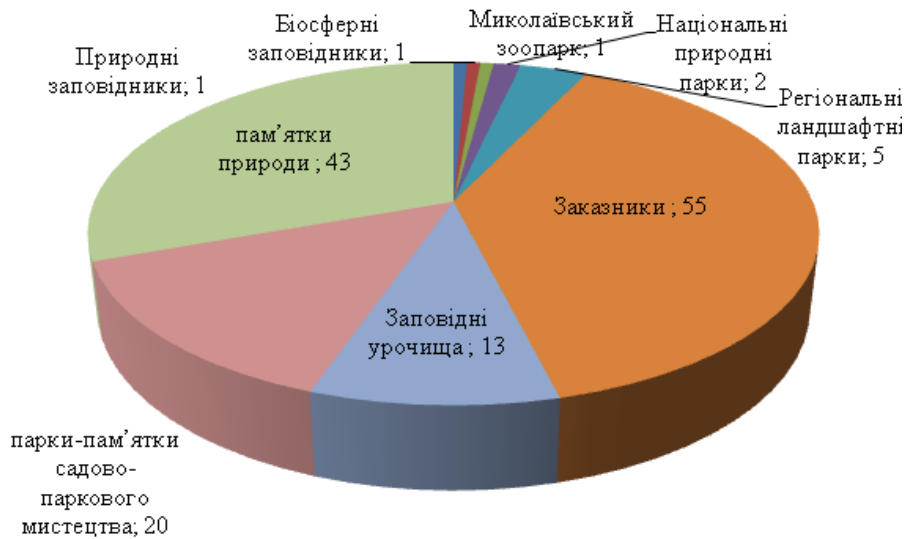
Рис. 4. Об'єкти природно-заповідного фонду області

спеціалізованих засобів розміщення – 223 (29603 місць) (а саме: санаторіїв – 15 (4356 місць), пансіонатів – 15 (3247 місць), баз відпочинку – 193 (22000 місць), 35 дитячих оздоровчих таборів на 8991 місце, які головним чином зосереджені в рекреаційно-оздоровчих зонах Березанського та Очаківського районів, а також у місті Очакові.