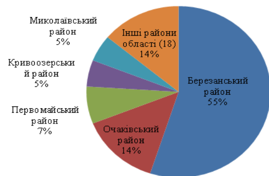
Рис. 3. Наявність об'єктів зеленого туризму в районах Миколаївської області

З таблиці бачимо, що Україну у 2018 році відвідало найбільше громадян з Молдови, Білорусії, Росії, Угорщини та Польщі.