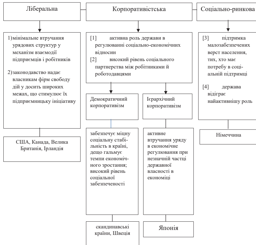
Рис. 1. Характеристики моделей економічного розвитку як основ побудови стратегії