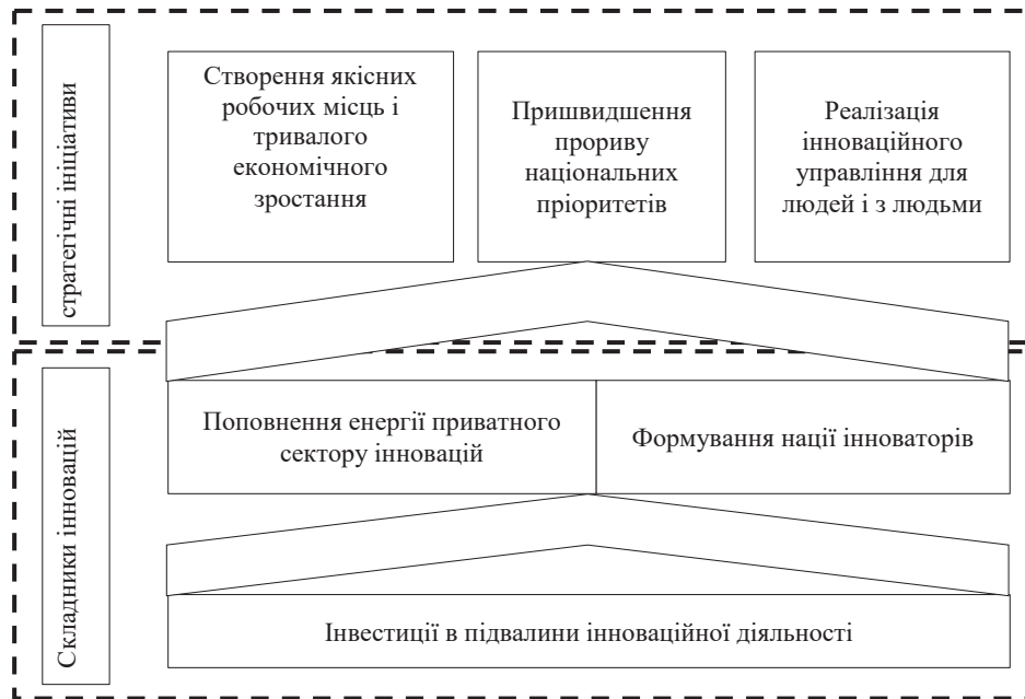
Рис. 2. Пріоритети інноваційної стратегії США 2015 року Складено за: [8]