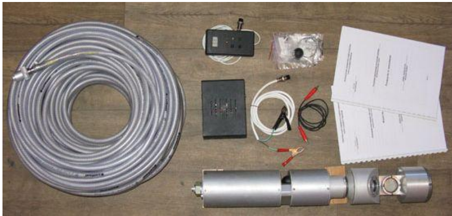
Рисунок 1 – Загальний вигляд комплекту апаратури прив'язної свердловинної відеокамери

Конструктивно ПСВ дозволяє виконувати обстеження свердловини на повітрі та під водою. До складу виробу надходять: прив'язна свердловинна камера; кабель-трос; пульт керування; джерело живлення; комплект з'єднувальних кабелів; комплект ЗІП; комплект експлуатаційної документації (рис. 1).