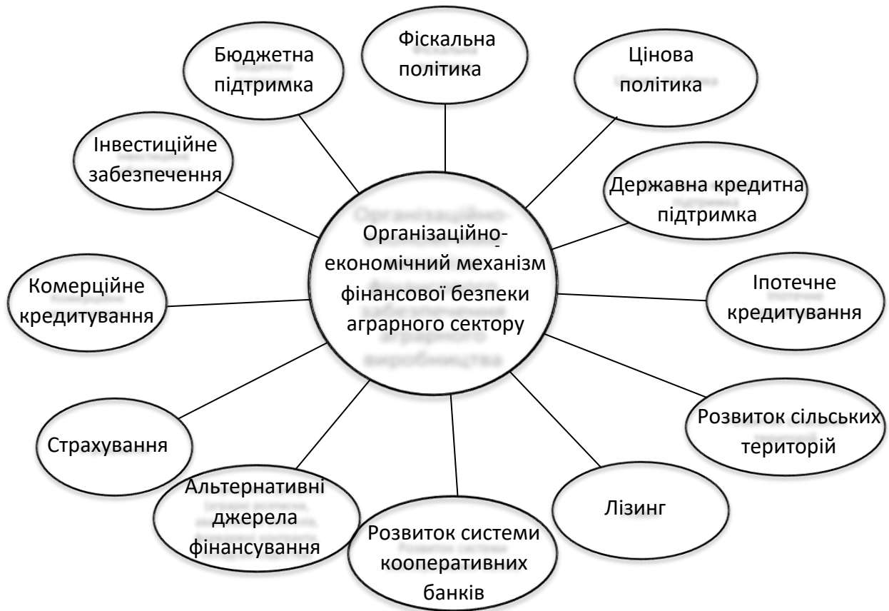
Рис. 3.1. Структура організаційно-економічного механізму фінансової безпеки аграрного виробництва