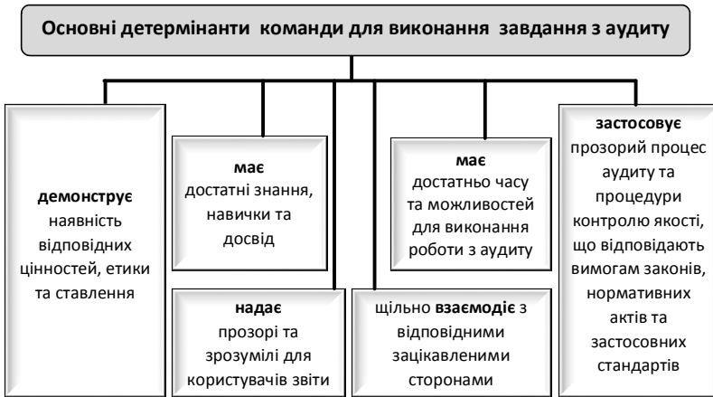
Рис. 1. Основні детермінанти команди для виконання завдання з аудиту на рівні аудиторської фірми

Загальні вимоги до аудитора під час проведення аудиту фінансової звітності, викладені в МСА 200 «Загальні цілі незалежного аудитора та проведення аудиту відповідно до Міжнародних стандартів аудиту» (рис. 2). Ці цілі фактично є підґрунтям для оцінки якості аудиту.