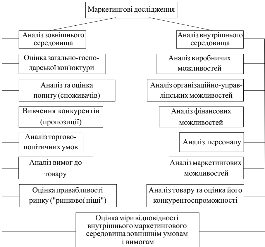
Рис. 1. Етапи проведення маркетингового дослідження

де M_p – місткість ринку чи повне споживання товару на даному ринку в рік (у фізичних одиницях); H_p – національне річне виробництво даного товару; E – експорт даного товару; I – імпорт даного товару; U – зміна залишків