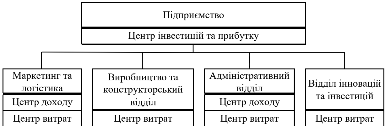
Рис. 2. Фінансова структура виробничого підприємства.

На рис. 2 наведено приклад фінансової структури виробничого підприємства.