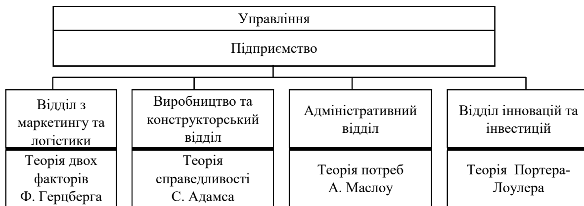
Рис. 4. Мотиваційні механізми для виробничого підприємства.

На рис. 4 запропоновані мотиваційні механізми для центрів фінансової відповідальності.