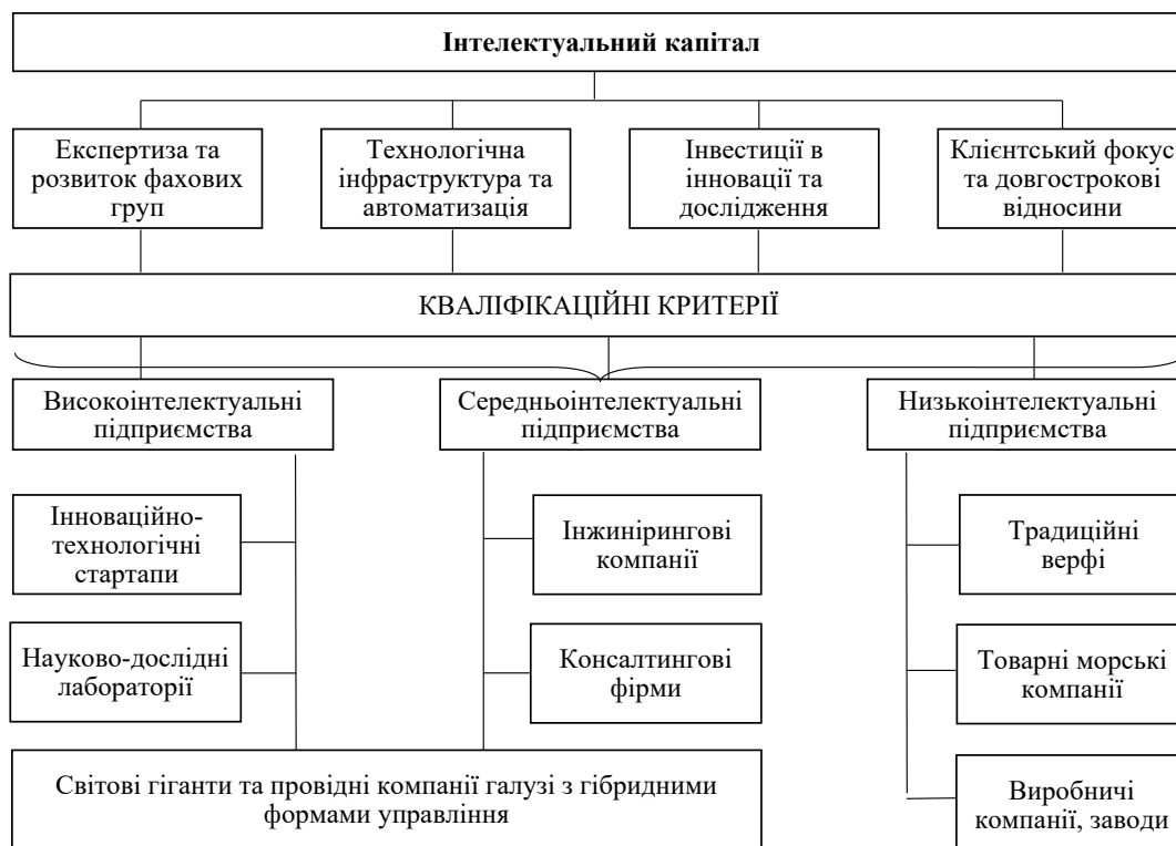
Рис. 2. Класифікація підприємств галузі за ознакою інтенсивності використання ІК