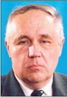
Oleg I. Solomentsev Соломенцев Олег Иванович