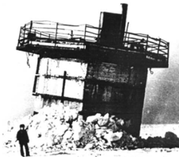
Рис. 2. Опорная конструкция строящейся платформы

Прогнозируемые ледовые условия используются для оценки ледовых нагрузок на буровую платформу и, следовательно, для оценки жизнеспособности предлагаемой конструкции платформы.