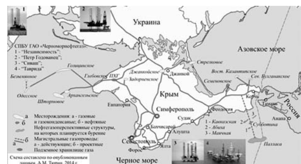
Рис. 1. Схема разрабатываемых месторождений в Азово-Черноморском бассейне

Опыт использования инженерных сооружений в Азовском море. В конце 70х годов XX века на шельфе Азовского моря предполагалось построить первую ледостойкую железобетонную платформу [6]. Опора такой платформы представляла собой многогранный железобетонный цилиндр диаметром 8 м с толщиной стенки 1 м. Опора закреплялась 16 вертикальными сваями, которые проходили внутри стенок цилиндрической части и забивались в грунт.