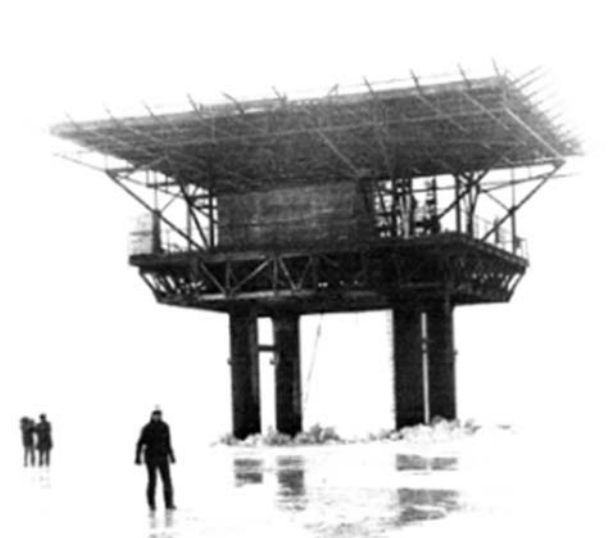
Рис. 3. Стальная морская платформа «Стрелка-2»