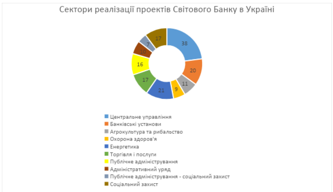
Схема 2.2 – Напрями реалізації проектів Світового Банку в Україні [24]

Така діяльність включає підготовку Меморандуму про економічний розвиток України, дослідження у сфері продовольства та сільського господарства, сільських бюджетів, енергетики та вугільного сектору, охорони навколишнього середовища та аналіз державних витрат на охорону навколишнього середовища [23].