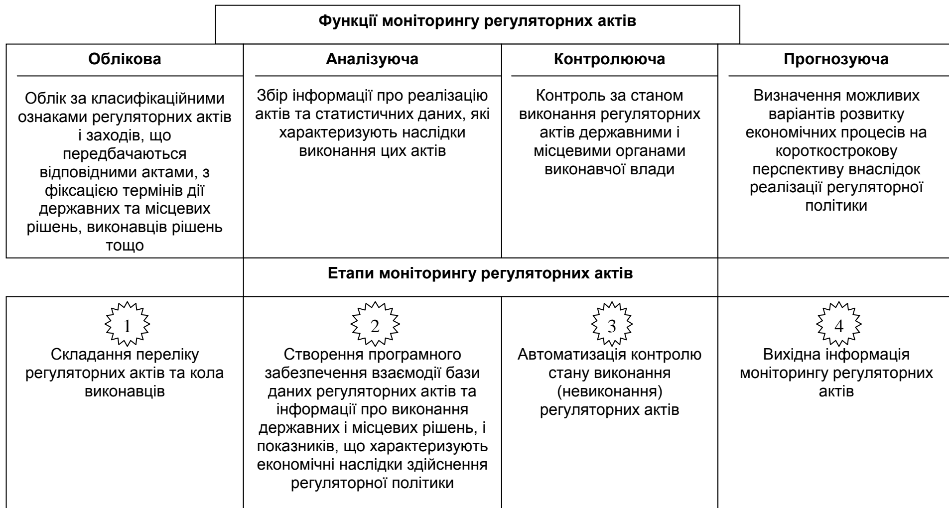
Рис. 1. Розроблення та практичне впровадження моніторингу регуляторних актів