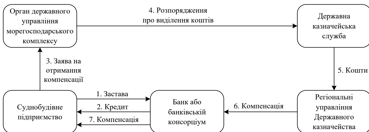
Рис. 4. Механізм компенсації за кредитами підприємства суднобудування

Для вдосконалення системи корпоративного менеджменту обґрунтовано актуальні для суднобудівного підприємства та водночас можливі, за сучасного стану інституціонального середовища, стимули державного регулювання його розвитку, що відповідають балансу суспільних і корпоративних інтересів; запропоновано механізм часткової компенсації вартості кредитів, залучених суднобудівним підприємством (рис. 4), та першочергові критерії компенсації.