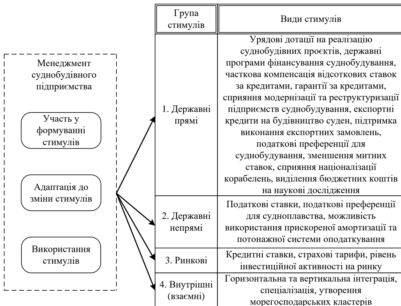
Рис. 1. Роль органів управління суднобудівним підприємством в економічному стимулюванні його розвитку

Визначено види економічних стимулів розвитку суднобудівного підприємства та роль його менеджменту в стимулюванні (рис. 1), яка полягає у формуванні й використанні стимулів та адаптації до їхніх змін.