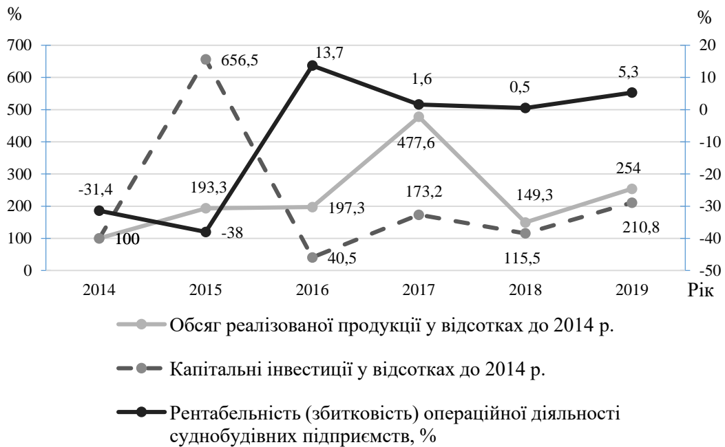
Рис. 3. Динаміка обсягів реалізованої продукції, капітальних інвестицій та рентабельності діяльності підприємств з виробництва суден і плавучих конструкцій

кризового 2014 року (рис. 3). Разом з тим, інвестиції зростають повільно та більш нестабільно в порівнянні з обсягами реалізованої продукції, що свідчить про недосконалість наявних економічних стимулів.